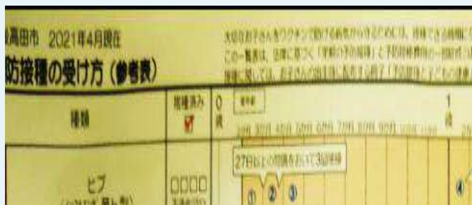
市より配布されていた旧スケジュール表 (before)