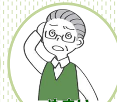
めまい 立ちくらみ