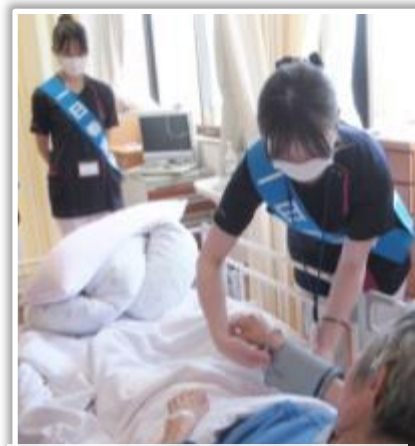
患者様の血圧測定