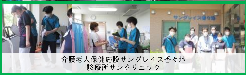
介護老人保健施設サングレイス香々地 診療所サンクリニック