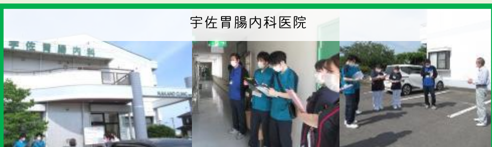
宇佐胃腸内科医院