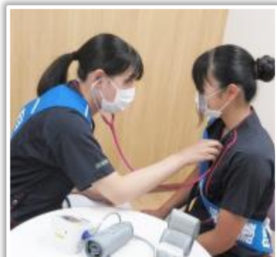
聴診器で心臓の音を確認

また患者様との会話の中では、高田高等学校の大先輩が居たことが発覚し和やかな雰囲気となりました。みなさんそれぞれに医療系の仕事に就きたいとのこと、この体験や情報提供が夢に近づききっかけになればと願っております。